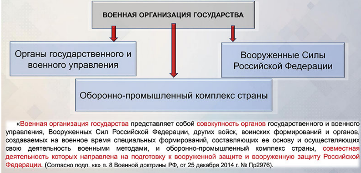
Рис. 1. Структура военной организации государства

Главная цель военной организации государства — гарантированная защита национальных интересов военной безопасности Российской Федерации и ее союзников.