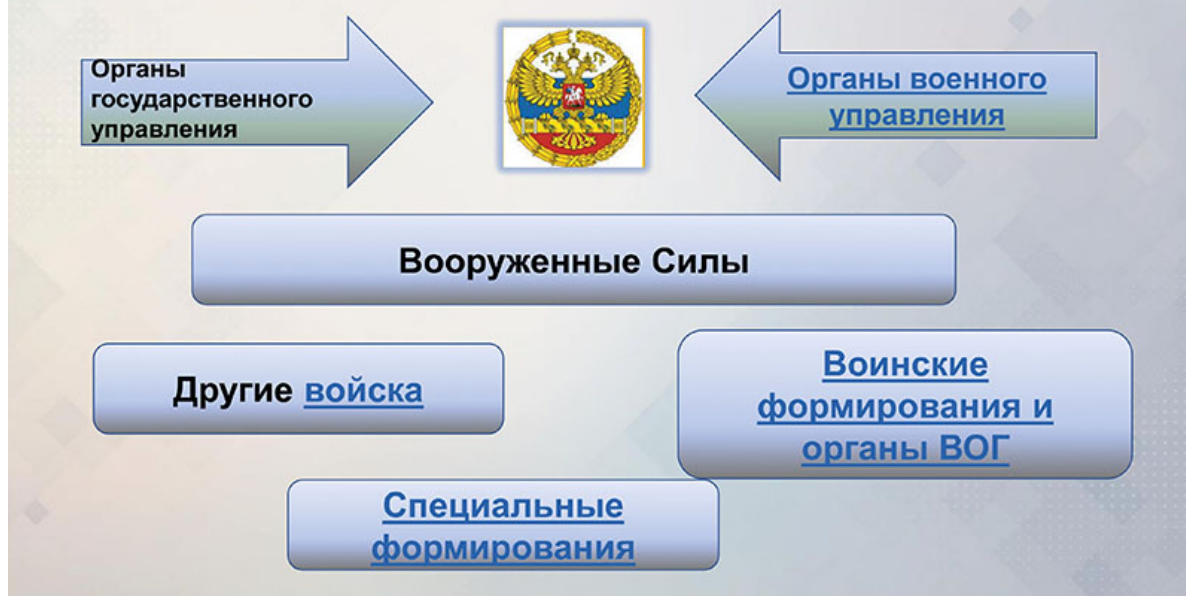
Рис. 3. Войска, воинские формирования и органы, привлекаемые к решению задач в области обороны

Под « другими войсками » законодательство подразумевает прежде всего Федеральную службу войск национальной гвардии Российской Федерации (Росгвардия) . Этот федеральный орган исполнительной власти осуществляет функции по выработке и реализации государственной политики и нормативно-правовому регулированию в сфере деятельности войск национальной гвардии Российской Федерации, в сфере оборота оружия, в сфере частной охранной деятельности и в сфере вневедомственной охраны (см. Указ Президента РФ от 30.09.2016 г. № 510 «О Федеральной службе войск национальной гвардии Российской Федерации» вместе с Положением о Федеральной службе войск национальной гвардии Российской Федерации).