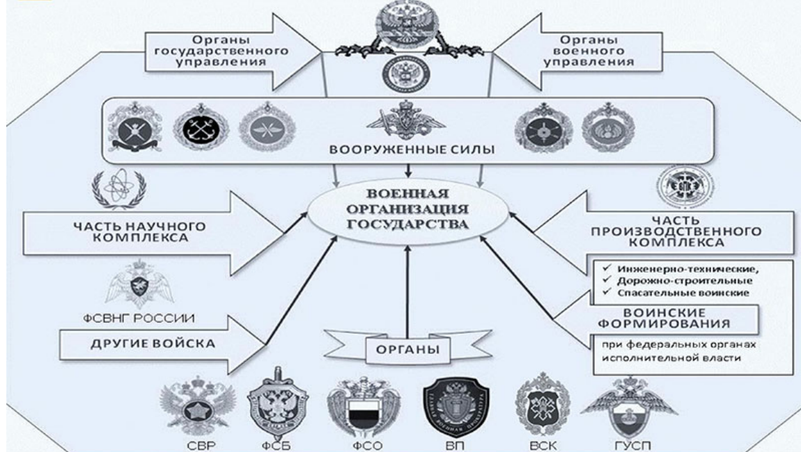
Рис. 2. Военная организация Российской Федерации

Они предназначены для отражения агрессии, направленной против Российской Федерации, вооруженной защиты целостности и неприкосновенности ее территории, а также для выполнения задач в соответствии с международными договорами Российской Федерации. Деятельность Вооруженных Сил Российской Федерации регулируется Конституцией, федеральными конституционными законами, федеральными законами, нормативными правовыми актами Президента Российской Федерации и иными нормативными правовыми актами.